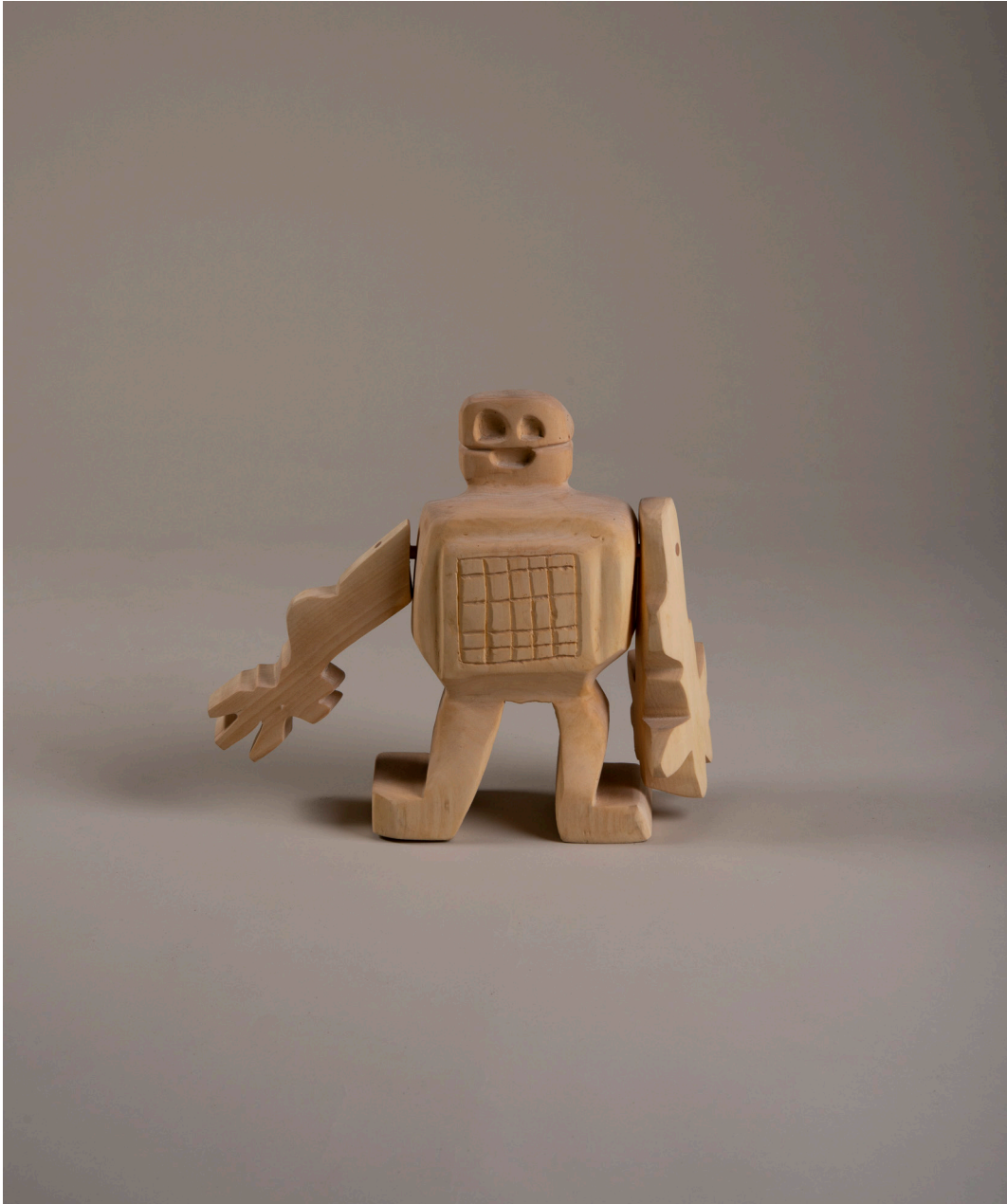
Die Besiedelung des Mars #3, Roboter, 39cm x 11cm x 34cm, Holz