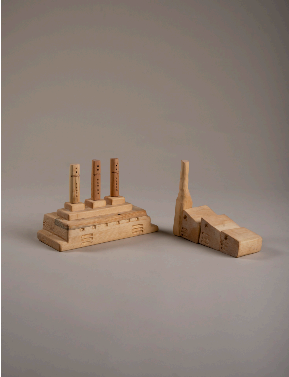
Die Besiedelung des Mars #6, Fabrik, 61cm x 36cm x 22cm, Holz