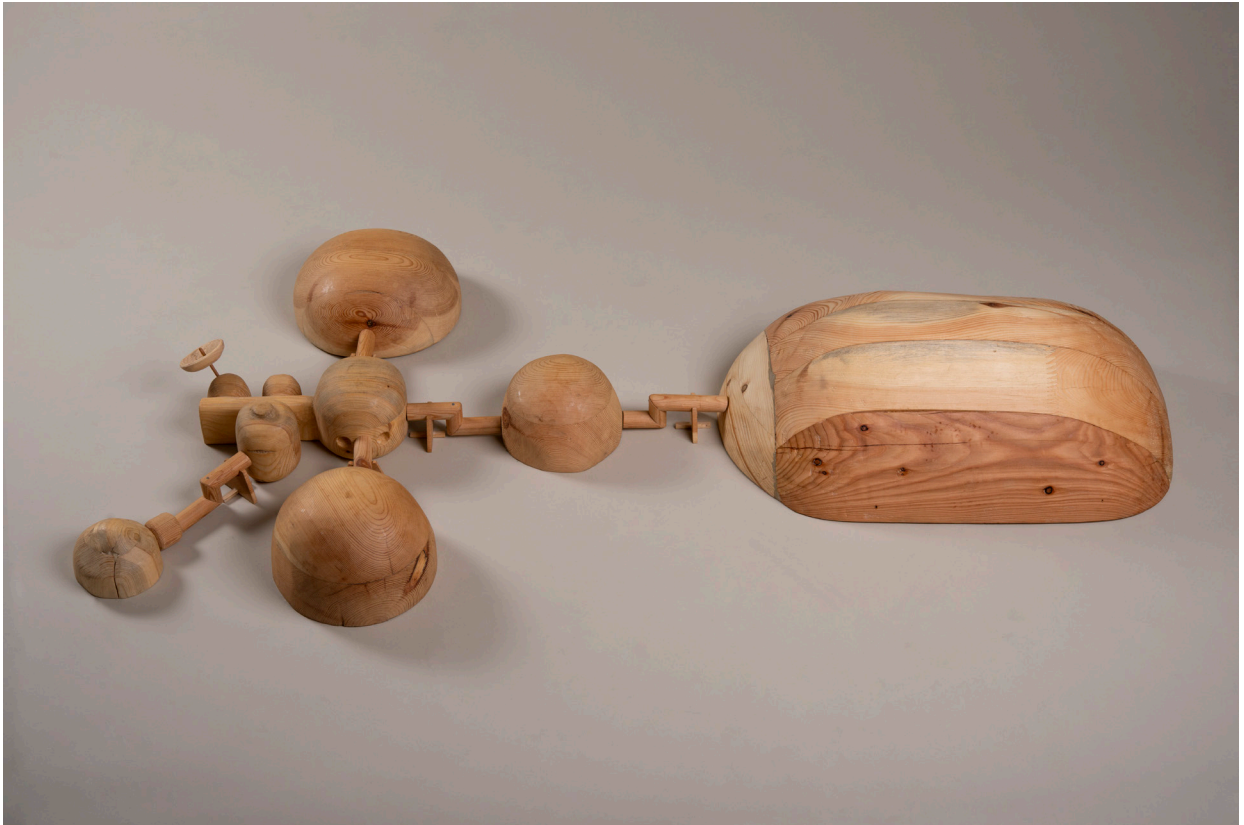
Die Besiedelung des Mars #8, Siedlung, 153cm x 89cm x 24cm, Holz