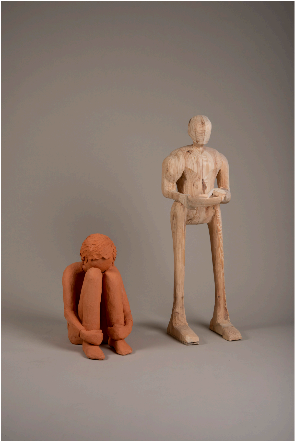
Die Besiedelung des Mars #1, zwei Figuren, 80cm x 47cm x 100cm, Holz, gebrannter Ton