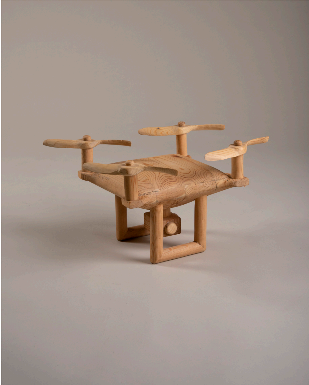
Die Besiedelung des Mars #4, Drone, 41cm x 43cm x 28cm, Holz