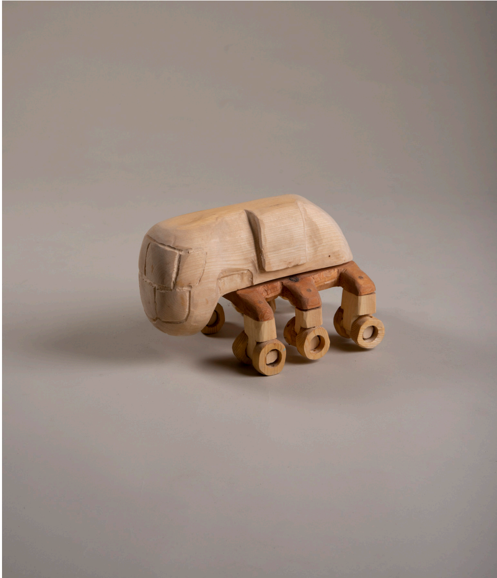
Die Besiedelung des Mars #5, Vehikel, 32cm x 22cm x 20cm, Holz