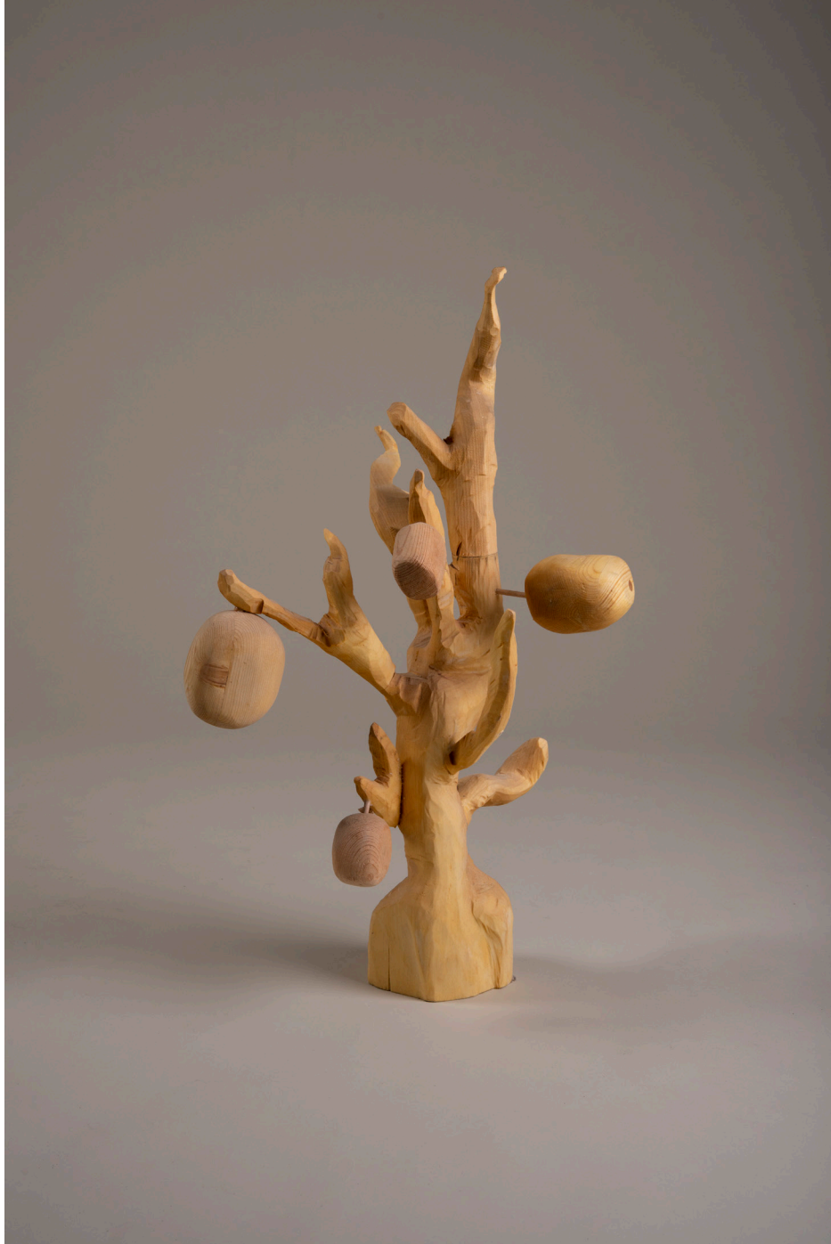
Die Besiedelung des Mars #2, Baum mit Nahrung, 42cm x 34cm x 69cm, Holz