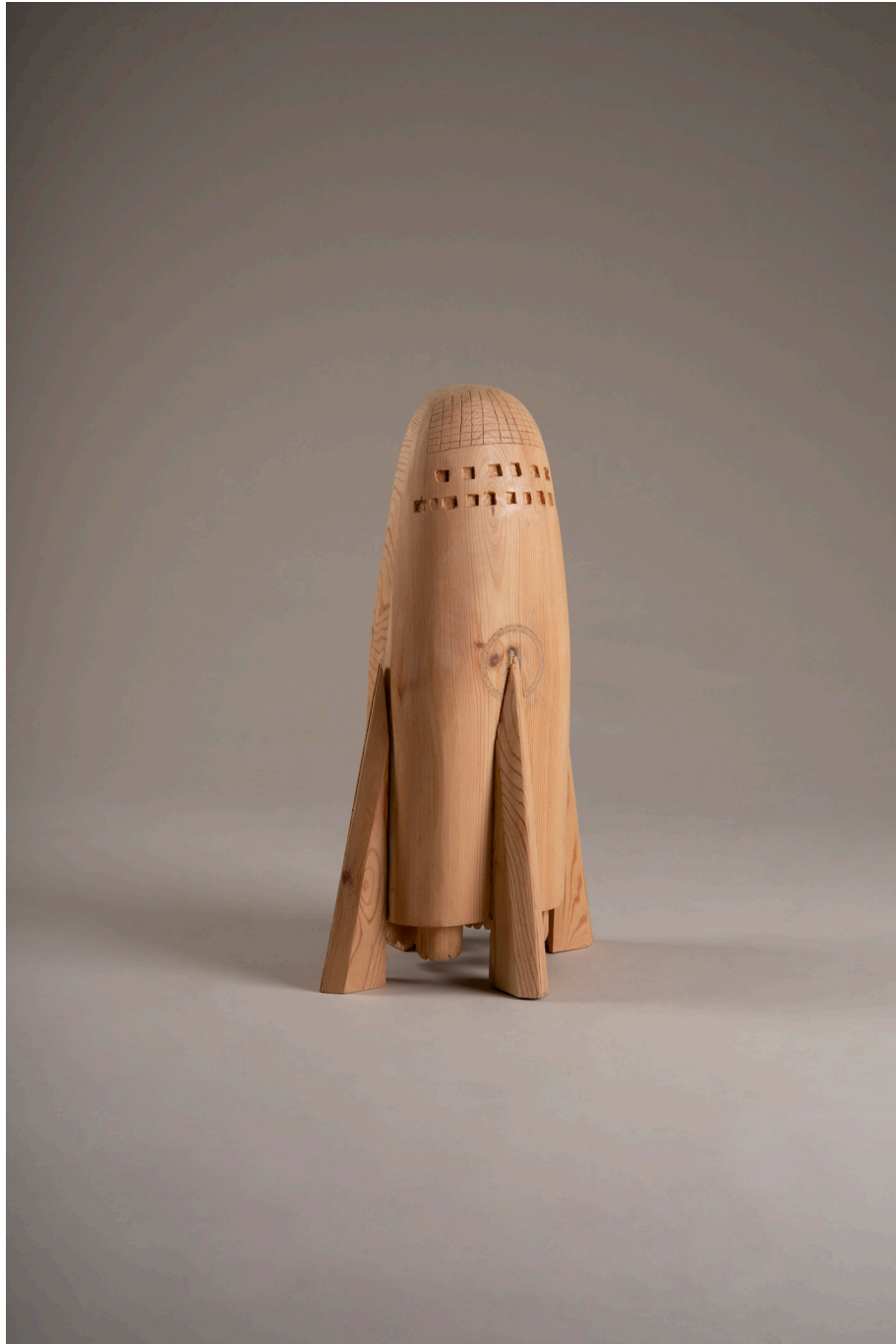
Die Besiedelung des Mars #9, Rakete, 37cm x 30cm x 64cm, Holz