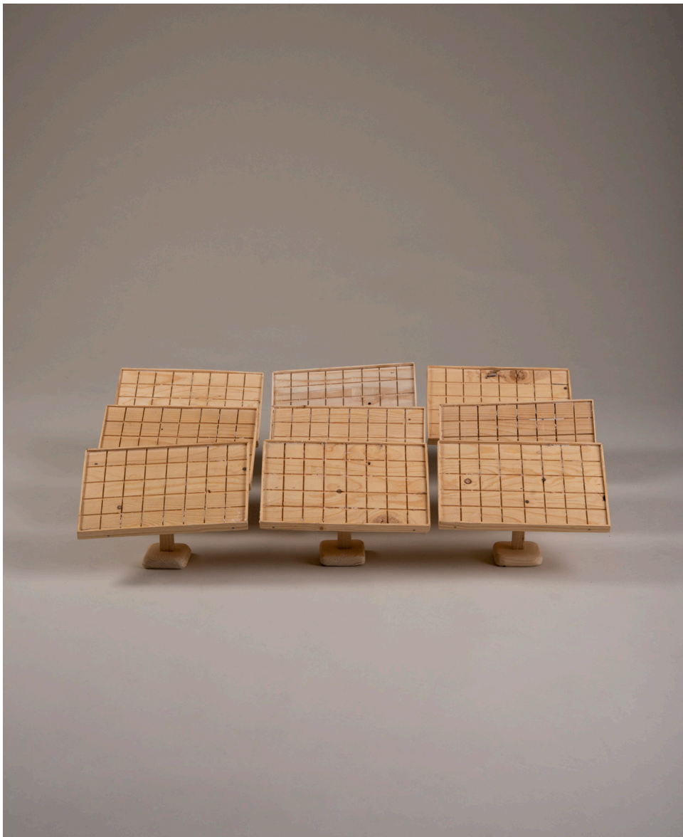
Die Besiedelung des Mars #7, Solarpanele, 77cm x 48cm x 19cm, Holz