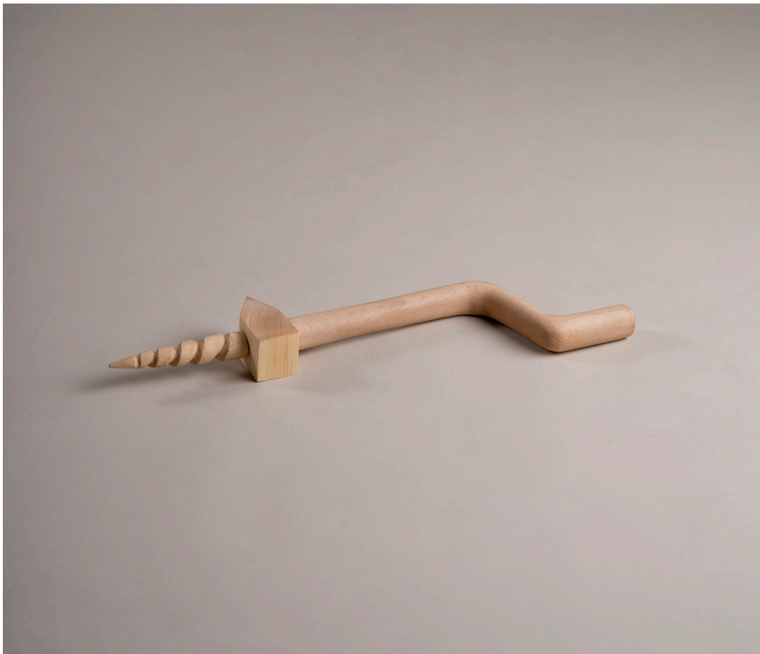
Die Besiedelung des Mars #10, Bohrhammer, 43cm x 19cm x 5cm, Holz