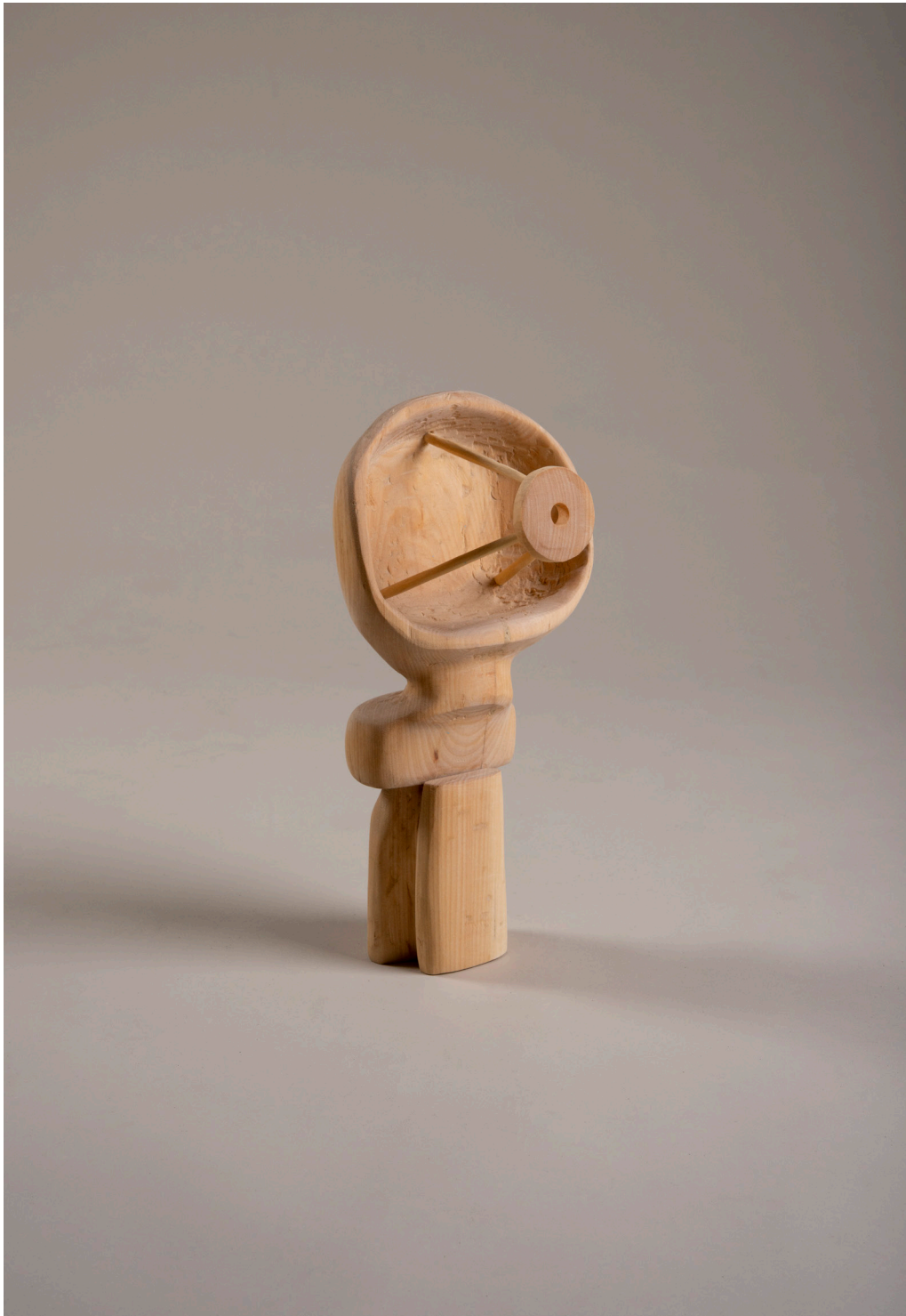
Die Besiedelung des Mars #12, Antenne, 21cm x 15cm x 39cm, Holz