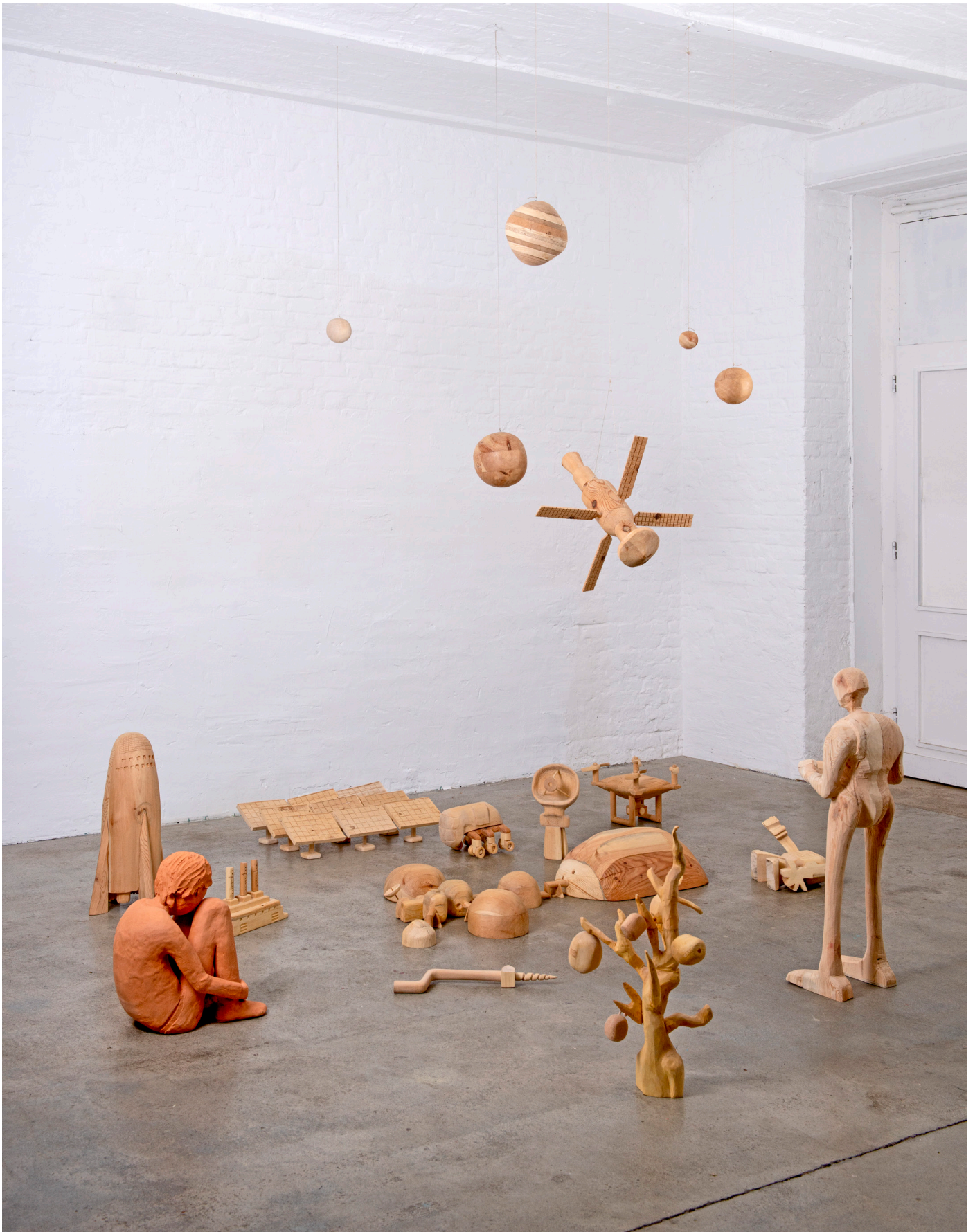
Die Besiedlung des Mars, Installationsansicht